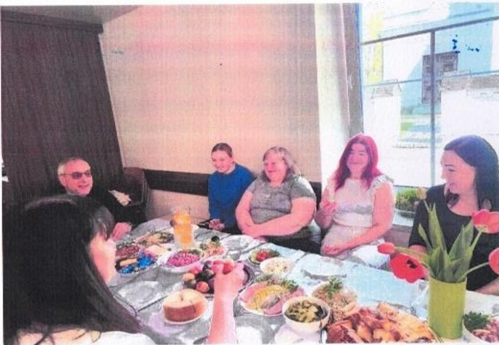
Velykos labdaros valgykloje